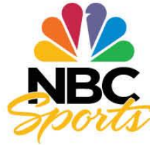
NBC Sports Los Angeles, États-Unis