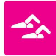
Los Angeles 1984