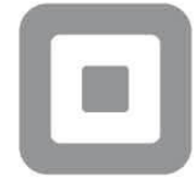
Square Inc San Francisco, États-Unis