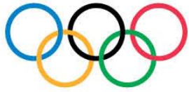
Comité international olympique Lausanne, Suisse